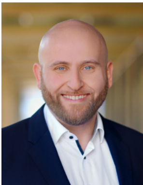
Leonid Chraga Vorsitzender Integrationsrat