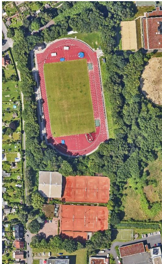
Verkehrsuntersuchung Hacheney - Infomesse 25.06.2025