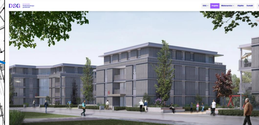
Wohngebietsentwicklung Stettiner Straße