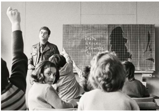
Hoeschmuseum 28.06.2026 und Ausstellung

Zur Finissage der Sonderausstellung „Wie's innen aussieht, geht niemand was an...“.