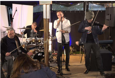
Nordstadt Session; Team Machbarschaft Borsig11

gemeinsames Erleben und kulturelle Vielfalt –unkompliziert, kostenlos und ohne Vorkenntnisse. So wird die Internationale Woche in der Nordstadt als lebendiger Ort von Austausch, Gemeinschaft und Musik erfahrbar.