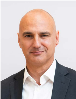
Alexander Kalouti Oberbürgermeister der Stadt Dortmund