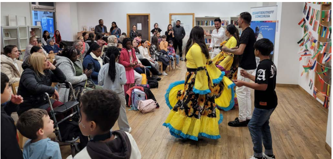
Interkultureller Tanzabend für Frauen

Veranstaltet von: Quartierstreff Concordia – gemeinsam am Borsigplatz