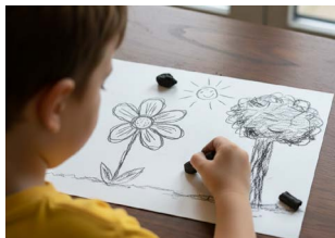
mondos Atelier: Kunst mit Kohle, mondo mio! Kindermuseum/ Gemini

mondo mio! Kindermuseum im Westfalenpark Florianstraße 2 (im Westfalenpark) • 44139 Dortmund